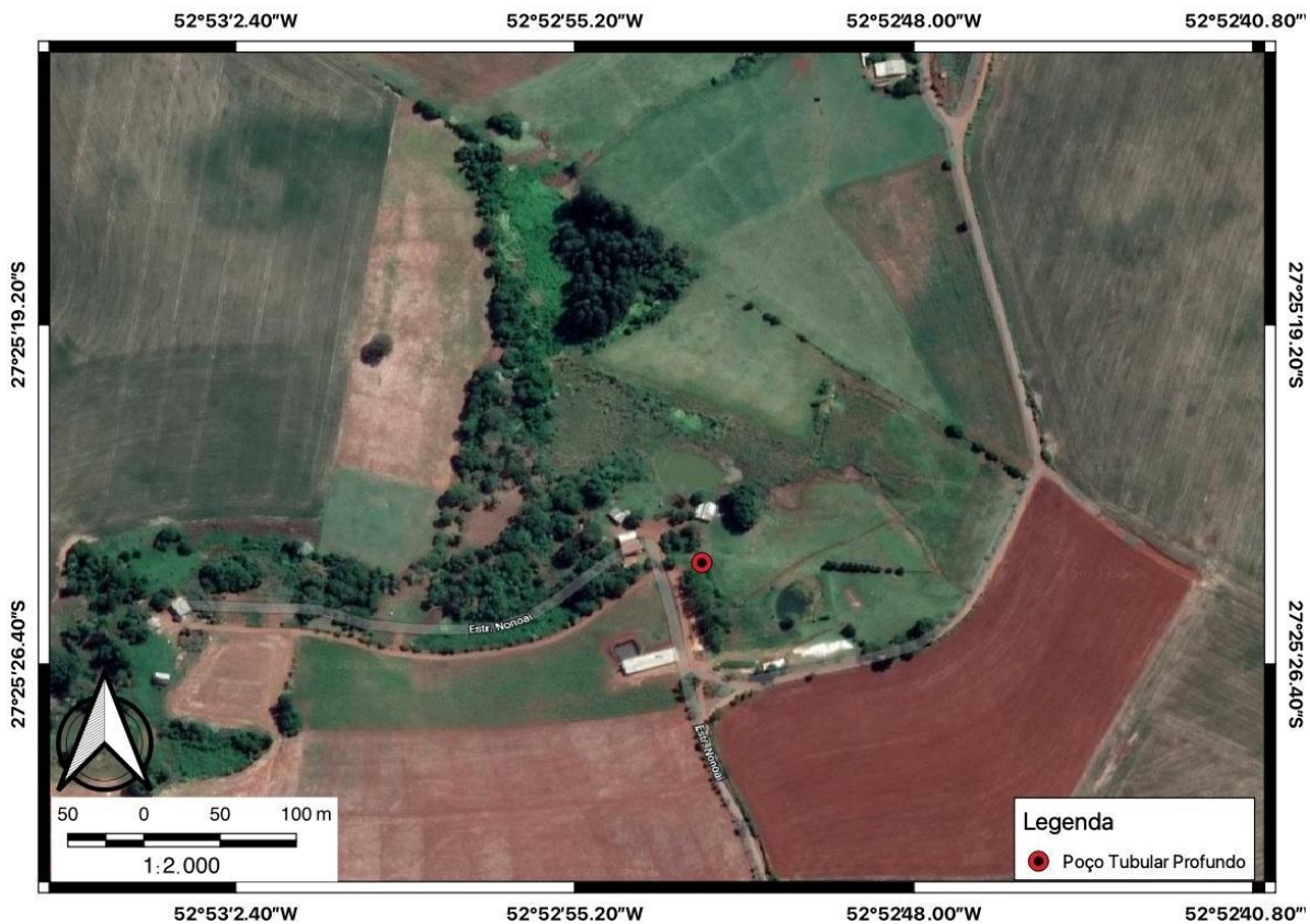
Figura 1: Mapa de Localização do Poço Tubular Profundo

Endereço: Secção Nonoai, Gramado dos Loureiros–RS.